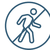
Restricción de movimiento

Los siguientes signos de advertencia podrían significar que alguien está atrapado en una situación de trabajo forzado. Si detecta algún signo de esclavitud moderna al interactuar con nuestros proveedores u otros terceros, infórmeleselo al Departamento de Legal y Cumplimiento de inmediato. Podría estar salvando la vida de alguien.