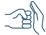
Violencia física y sexual