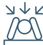
Conditions de travail et de vie inacceptables