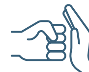
Violence physique ou sexuelle