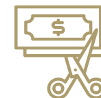
Retenue de salaires