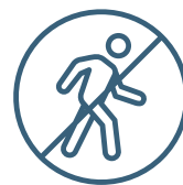
Restriction des déplacements

Les signaux d'alerte ci-dessous peuvent indiquer une situation de travail forcé. Si vous observez des signes d'esclavage moderne dans vos interactions avec nos fournisseurs ou d'autres tiers, informez immédiatement le service juridique et conformité. Vous pourriez sauver une vie.