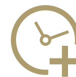
Heures supplémentaires excessives