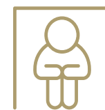
Isolement des travailleurs