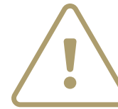
Đe dọa và hăm dọa