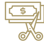
Giữ lại tiền lương