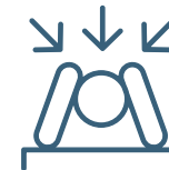
Điều kiện làm việc và sinh hoạt bị ngược đãi