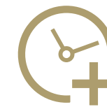
Làm thêm giờ quá mức